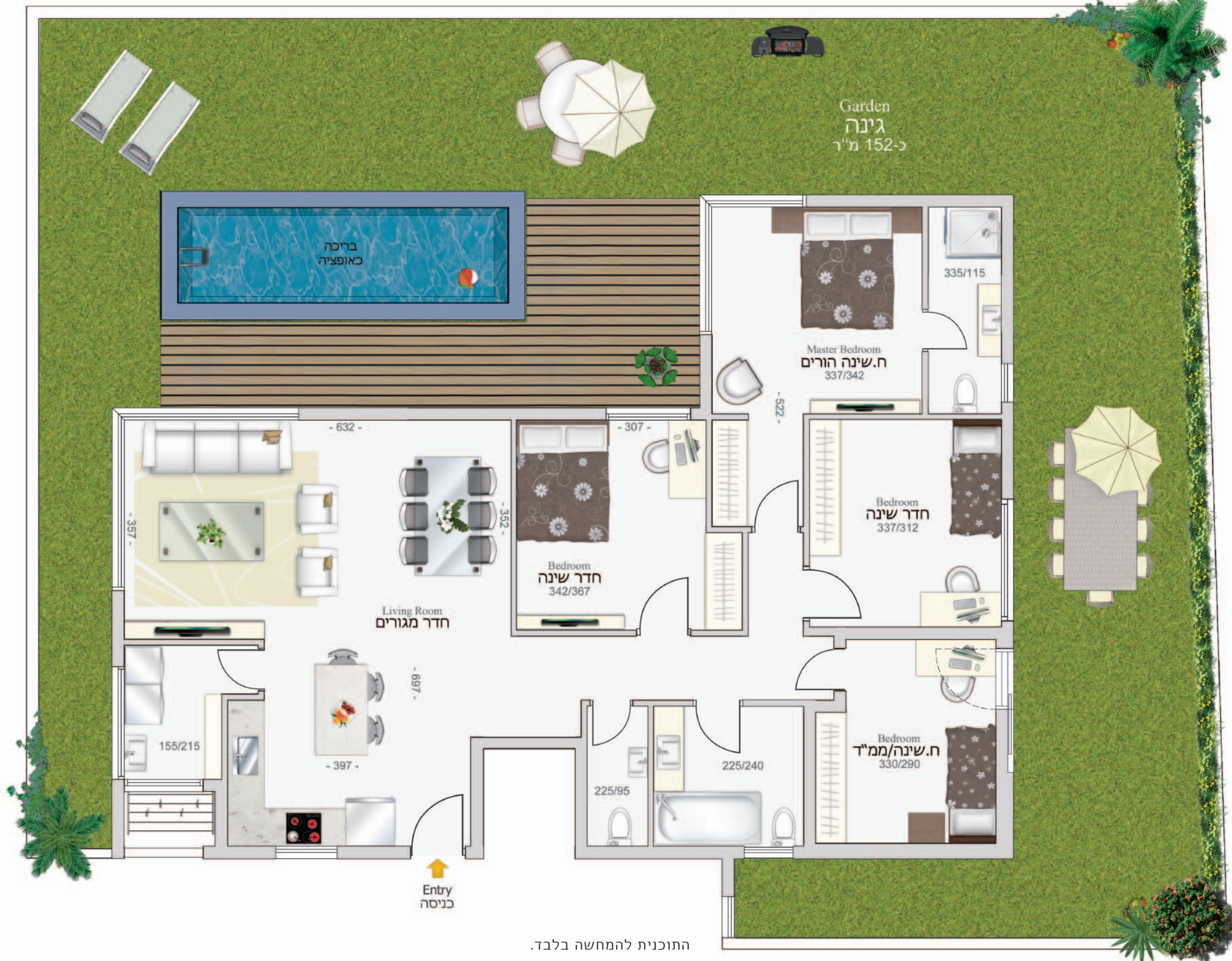
התוכנית להמחשה בלבד.